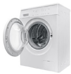
GROS APPAREILS ÉLECTROMÉNAGERS

pour savoir si un objet est réemployable, demandez aux agents du SIMER