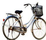
SPORTS ET LOISIRS