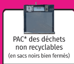
PAC* des déchets non recyclables (en sacs noirs bien fermés)