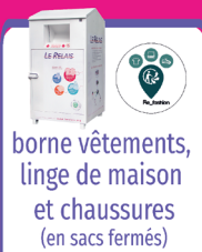
borne vêtements, linge de maison et chaussures (en sacs fermés)