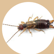
Les perce-oreilles • pucerons