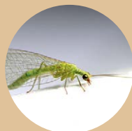
Les chrysopes • pucerons • cochenilles • œufs d'acariens