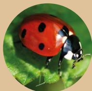
Les coccinelles • pucerons • cochenilles

• planchettes rapprochées pour les coccinelles