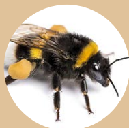
Les abeilles solitaires • bonne pollinisatrice • elle est inoffensive